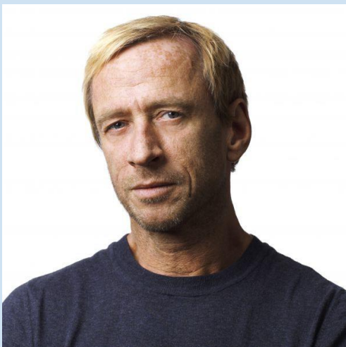
Inspirationsföreläsning om att vägen fram inte alltid är rak

Att få se andras verksamhet, och få berättat om intressanta och nytänkande är alltid givande!