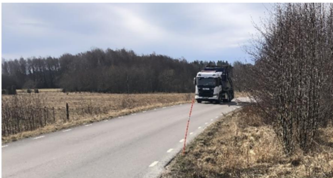
Figur 2 Tynäsvägen med cirka 1000 fordon/dag idag, 40 km/h utan godkänd stoppsikt enligt VGU för fordon eller cyklar