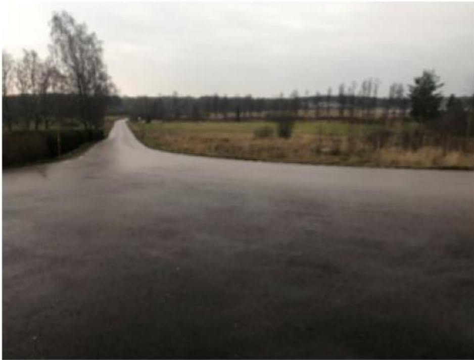
Figur 1: Tynäsvägen behöver översvämningssäkras

eller erosion (11 kap. 10 § andra stycket 5 och 11 kap. 11 § PBL). Vägen bör vara översvämningssäkrad, eller åtminstone ha en offentligt antagen plan, innan en detaljplan i området godkänns. Ny väg är i planeringsfasen, men ej antagen, vilket den bör vara före exploatering.