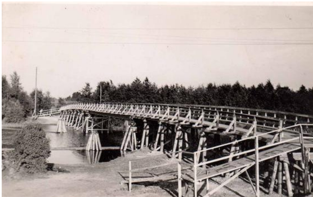
Brobygge ca 1928